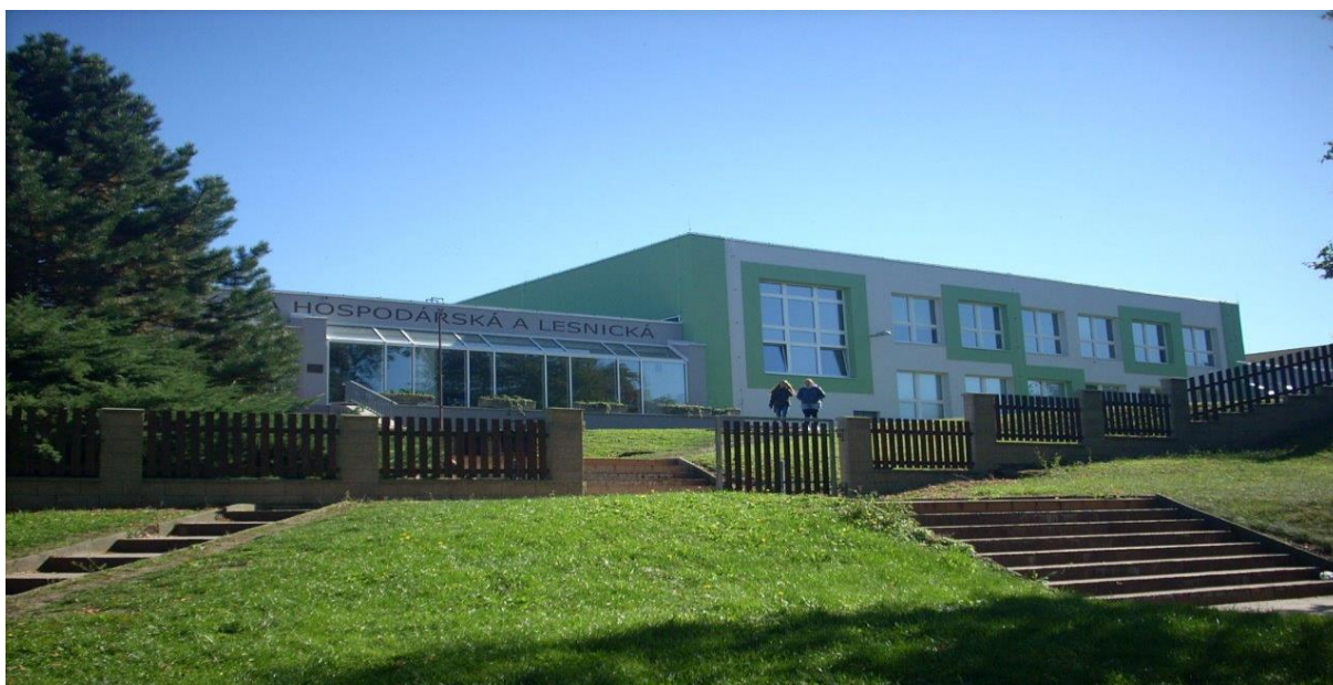
Budova školy, Bělíkova, Frýdlant