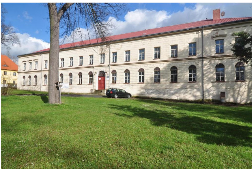
Budova školy pracoviště Zámecká