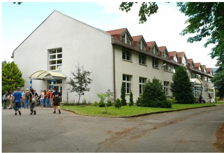
Budova školy v Hejnicích